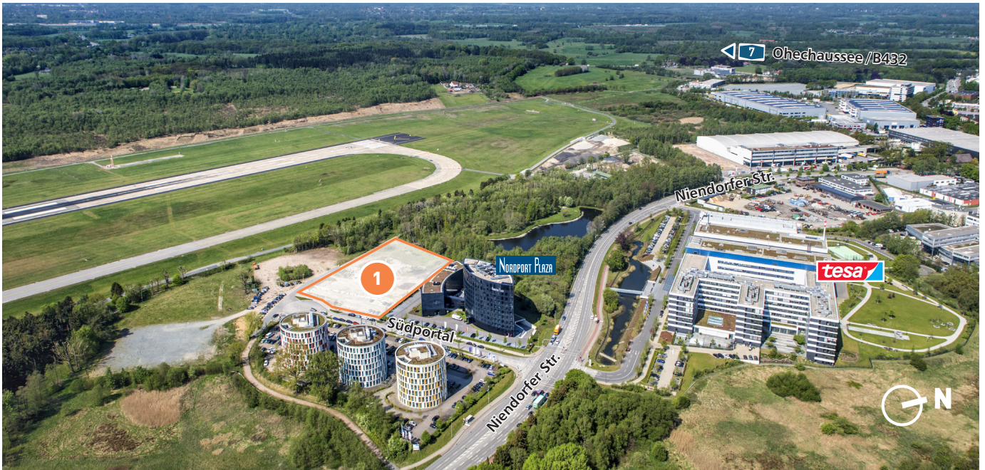
Blick auf die noch verfügbare Fläche im Südportal des NORDPORT (B245)